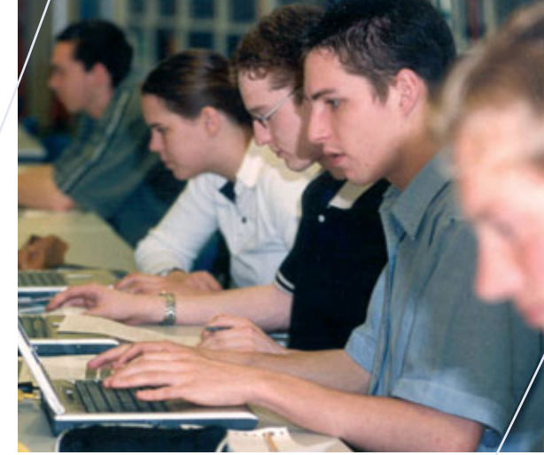
Hoger-opgeleiden moeten hun eigen competenties in kaart brengen.

sociale vaardigheden als contact leggen en reflecteren op het zelfbeeld. Hoewel er binnen de grotere bedrijven al diverse mogelijkheden voor self assessment bestaan, pleit ik ervoor om deze mogelijkheden nóg laagdrempeliger te maken. Want door bij- en omscholing kunnen hoger-opgeleide medewerkers langer binnen het bedrijf blijven en doorstromen naar andersoortige functies.” Ook het CWI zou bij de instroom van hoger-opgeleiden een grotere rol moeten spelen. Maar dan moeten wel de mogelijkheden op het gebied van vraag en aanbod aanzienlijk worden verbeterd. Het rapport geeft ook daar veel aanbevelingen voor.